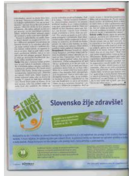
23.3. 2007 Nový čas