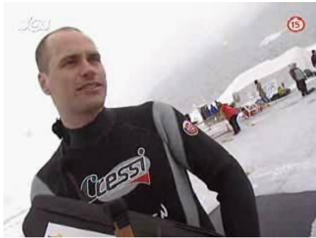
23.3. 2007 PLUS 7 DNÍ, reportáž „Naruby“